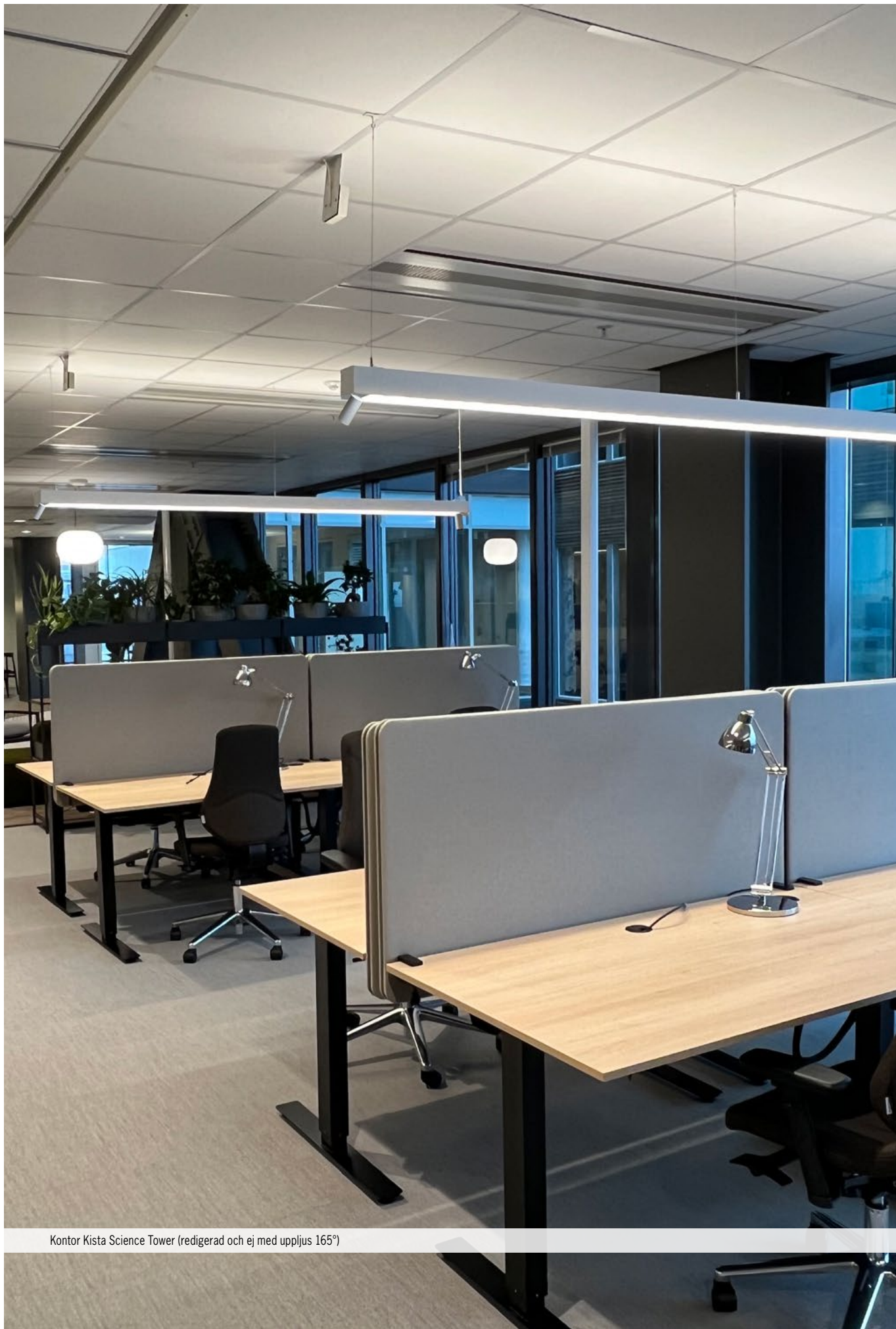
Kontor Kista Science Tower (redigerad och ej med uppljus 165°)