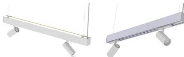
Tillval: Integrerad 3-fasskena för spotlights / Integrerade spotlights fasta positioner