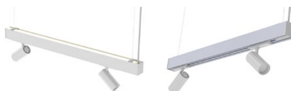
Sensor, ökar armaturens längd med 22mm

Tillval: Integrerad 3-fasskena för spotlights / Integrerade spotlights fasta positioner